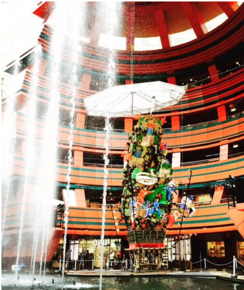
過去の飾り山笠の様子