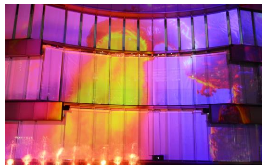
※上演の様子 TM&©TOHO CO., LTD.