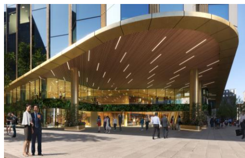
「コネクティッドコア」地上広場イメージ

敷地北東側に地上・地下の歩行者ネットワークの核となる大規模立体広場「コネクティッドコア」を整備し、博多駅から住吉通りやはかた駅前通りへの回遊性向上に繋がります。また、博多まちづくり推進協議会等による様々なイベント利用に対応し、博多駅前の賑わいの広がりを創出します。