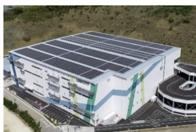
ロジシティ古賀 太陽光発電（一部、自家消費）