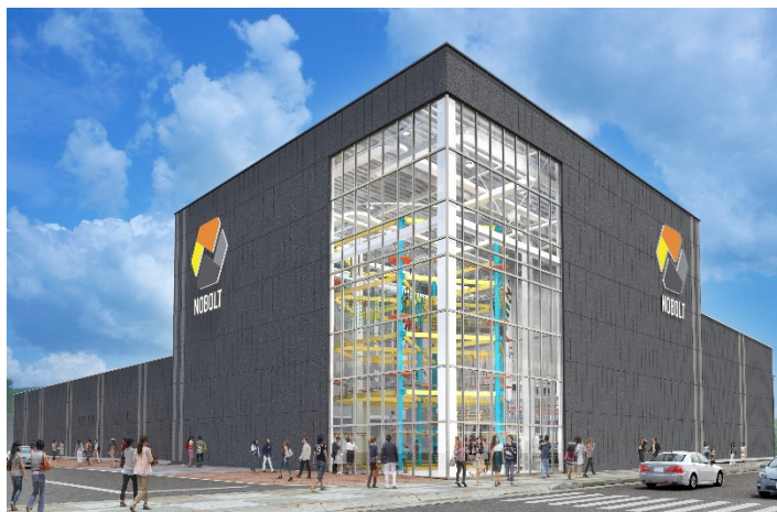
※写真素材はイメージです。