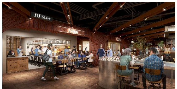
「天神イナチカ」内観イメージ