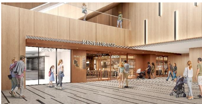
「天神イナチカ」エントランスイメージ

京都・東京・香港を拠点とし、レストランやホテル・物販店のインテリアデザイン、住宅やオフィスビルなどの建築設計を行っており、インテリアと建築の互いの視点を考慮し、その土地の歴史、文化、風土を紡ぎながら作り出される空間は国内外問わず、高く評価されています。近年は、「Four Points by Sheraton 名古屋 中部国際空港」、「ザ・ホテル青龍 京都清水」などのデザインを手がけています。