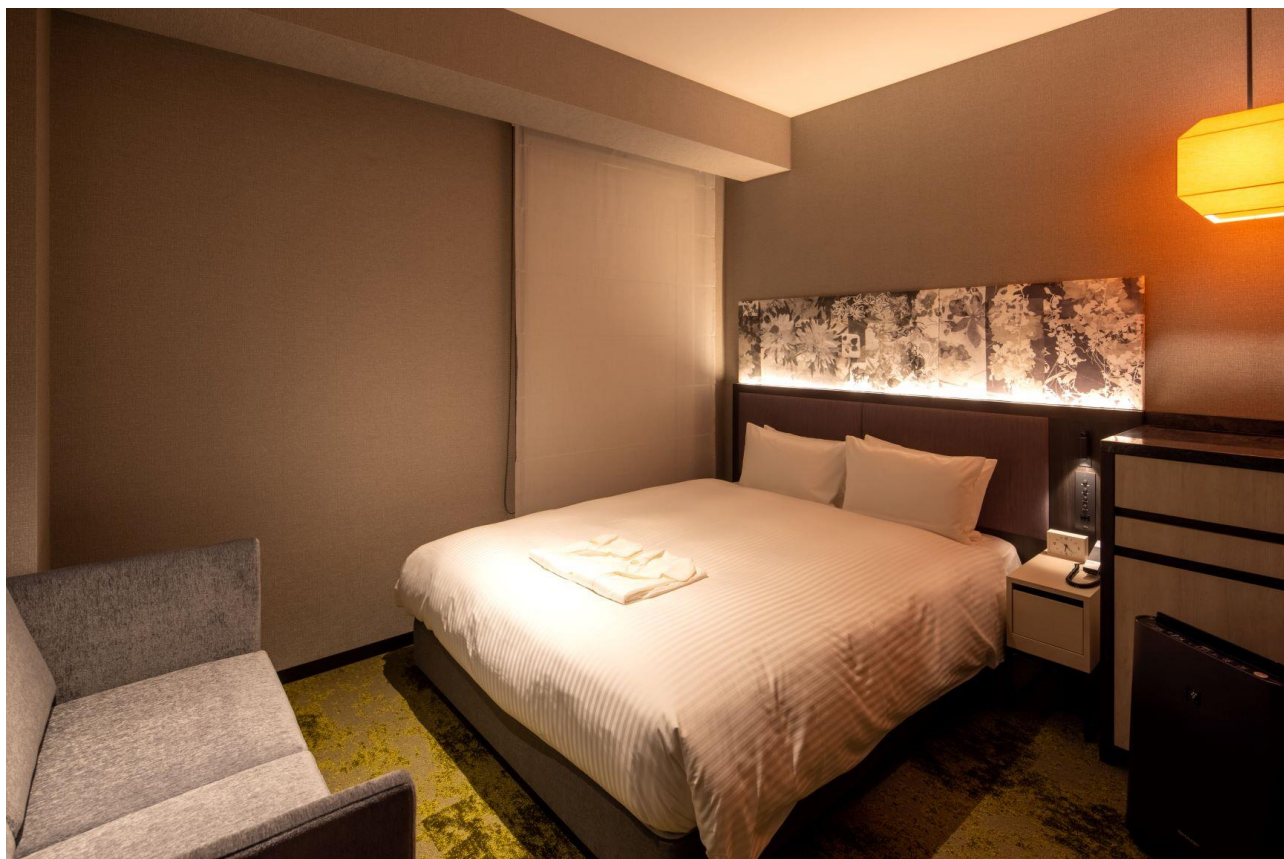
フォルツァダブルルーム

観光都市京都のホテルに相応しく、お部屋でお過ごしになるお時間もより楽しいものに演出いたします。