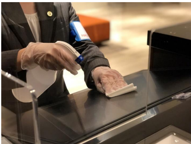
除菌作業 イメージ