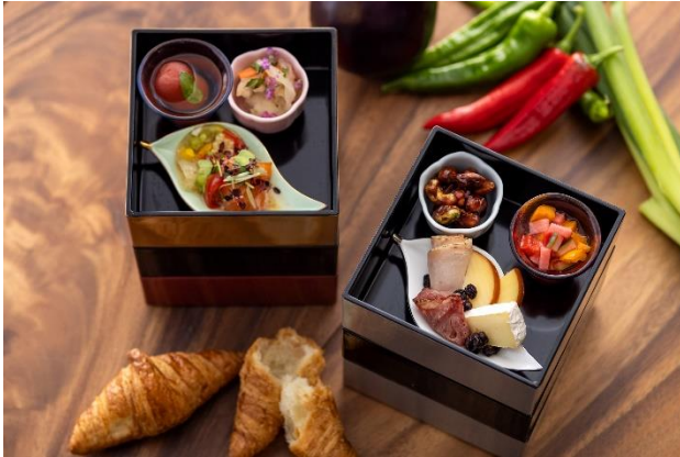
朝食 洋食献立イメージ