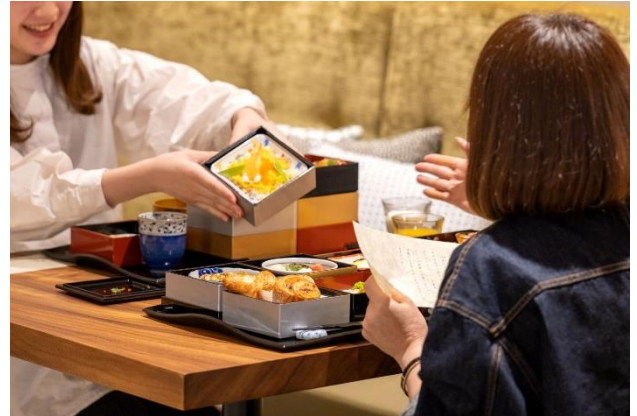
季節感と京都らしさを大切にいたしました