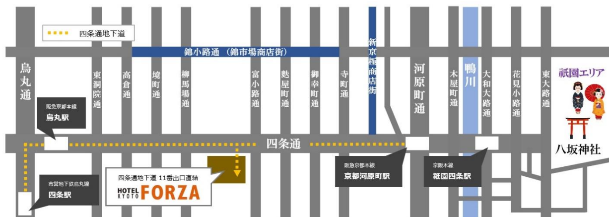
ホテルフォルツァ京都四条河原町、周辺略図