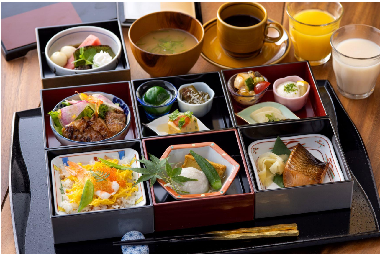
朝食 和食献立イメージ