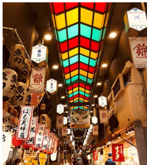
京都錦市場商店街

「四条通り」や近くの「錦市場」には、京都ならではの歴史ある店舗からさまざまな店舗が並び、ご旅行中のお食事やお買い物をお楽しみいただけます。