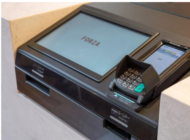
安心・安全に素早くチェックイン！

ホテルフォルツァでは、お客さまならびに従業員の健康と安全を第一に、お客さまにより安心してお過ごしいただけるよう衛生管理に努めております。