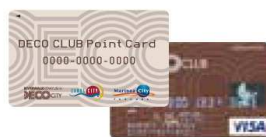
[デコクラブカード]