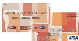
[キャナルシティカード]