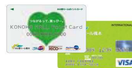
[木の葉モールカード]