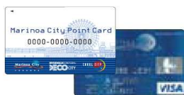
[マリノアシティカード]