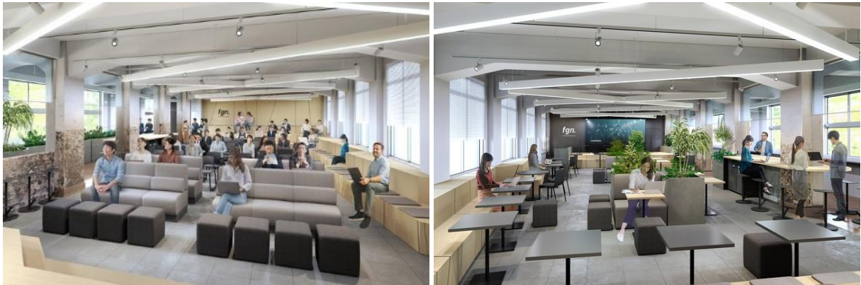
イベントスペース リニューアルイメージ（計画図面のため変更の可能性があります）

FGN の象徴となるイベントスペースの収容人数を 2 倍超に拡大し、150 名規模のイベント実施に対応します。さらにオンライン配信に対応した映像・音響設備を整備し、オンライン・オフラインのハイブリッド形式でのイベントにも対応。施設やスタートアップの情報発信力を強化します。イベントスペースでイベントが実施されていないときは入居者にワークスペースとして提供し、コラボレーションワークを進めることができます。