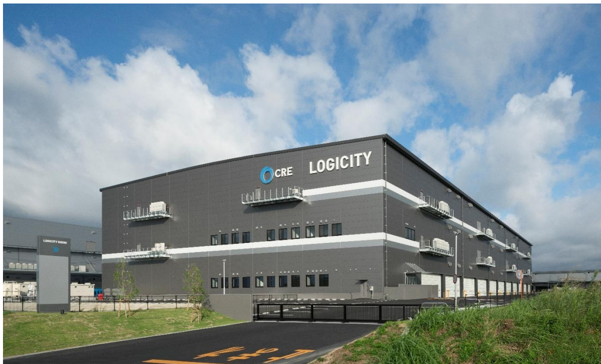
ロジシティ小郡 全景

※BTS(ビルド・トゥ・スーツ)型:特定ユーザーの希望する立地において、そのニーズに基づいた施設を開発するオーダーメイド型の賃貸用物流施設