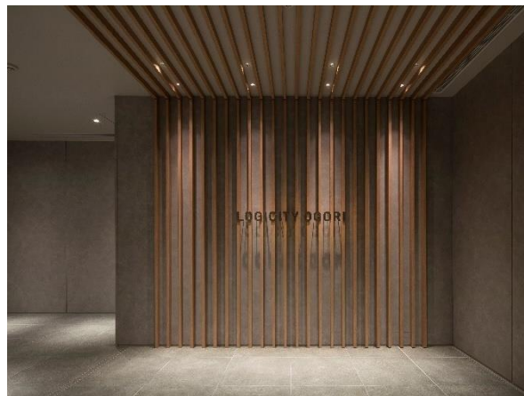
ロジシティ小郡 エントランス