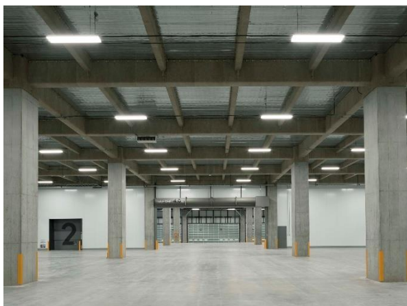
ロジシティ小郡 倉庫内部