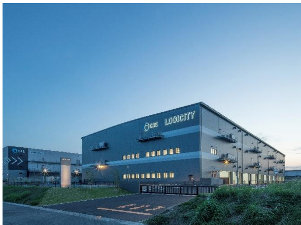
ロジシティ小郡 全景（夕景）