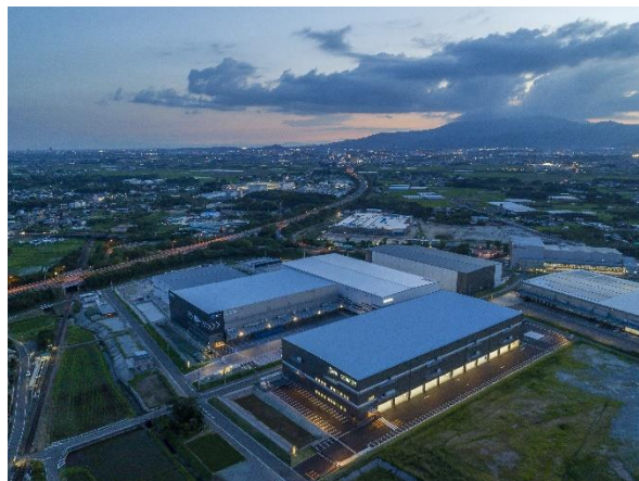
ロジシティ小郡 全景（俯瞰）