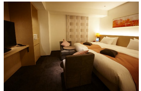
参考画像 ホテルフォルツァ博多(筑紫口) リラクシングツインルーム

ホテル名称： ホテルフォルツァ大阪北浜(仮称) 所在地： 大阪市中央区今橋2丁目 京阪本線、堺筋線「北浜駅」徒歩1分 敷地面積： 822平米(248坪) 室数： 約200室 開業時期： 2019年夏予定 事業主： 中江産業株式会社 設計： 株式会社山下設計 施工： 未定 デザイン： 有限会社バジック