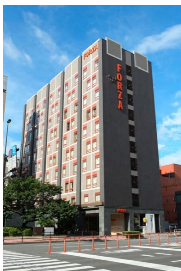
参考画像 ホテルフォルツァ大分