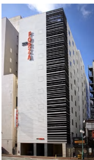
参考画像 ホテルフォルツァ博多（筑紫口）