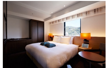
参考画像 ホテルフォルツァ長崎 デラックスダブルルーム

ホテル名称： ホテルフォルツァ札幌駅前(仮称) 所在地： 札幌市中央区北3条西2丁目 JR札幌駅 南口 徒歩4分 地下鉄東豊線「さっぽろ駅」13番出口より徒歩2分 敷地面積： 894平米(270坪) 室数： 約200室 開業時期： 2019年春予定 事業主： 福岡地所株式会社 設計： 株式会社山下設計 施工： 未定 デザイン： 株式会社カッシーナ・イクスシー