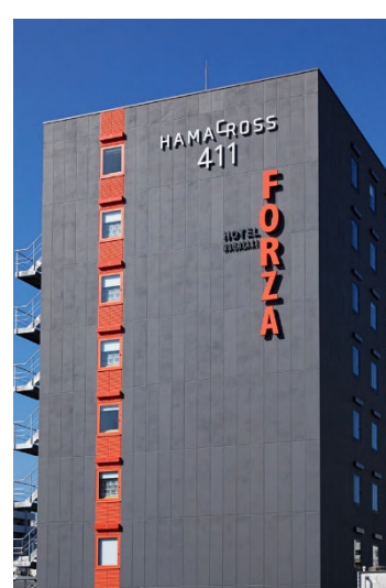
参考画像 ホテルフォルツァ長崎