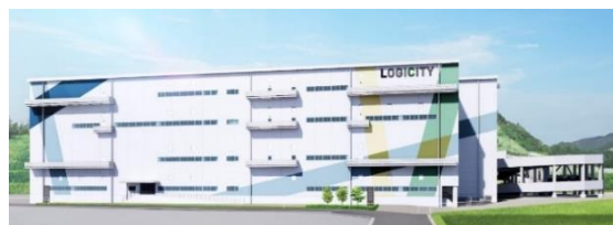
(仮称) ロジシティ古賀青柳

福岡地所は、機能性とデザイン性を兼ね備えた物流施設「ロジシティ」シリーズの開発を複数進めており、エフ・ジェイロジは、より高品質な物流拠点を確保する上で、同業他社と比較して優位性の高い物流戦略・計画の提案が可能です。